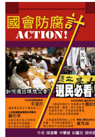
《國會防腐計ACTION!》 讓台灣國會脫線、醜態、惡行和亂象，不再重蹈覆轍，義賣價300元