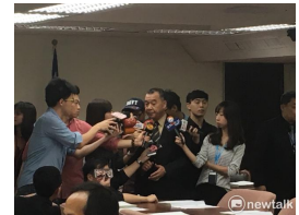
【新頭殼】八百壯士9日再赴立法院抗爭 邱國正：不樂見激烈舉動 (詳見全文)