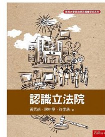
《認識立法院》 作者：黃秀端(公督盟理事長) 簡介：內容包含法案與預算的審議以及政黨間攻防及選區經營的內幕。 (有意購書，請至各大書局詢問)