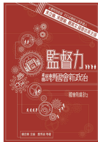
《監督力：翻轉國會新政治》(國會防腐計2) 特別收錄蔡英文國會改革主張，義賣價300元