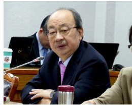
【聯合新聞網】技術性卡釋憲 許毓仁：以後在野黨哭救無門了！ (詳見全文)