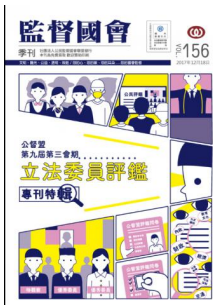
《監督國會》季刊第156期 全國唯一國會監督專刊 來電免費索取 02-2367-1571